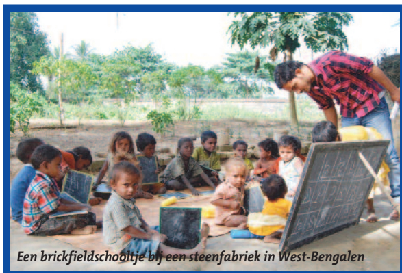
Een brickfieldschooltje bij een steenfabriek in West-Bengalen

Van 29 oktober tot 20 nov. jl. bezochten leden van de projectcommissie diverse locaties en projecten in West-Bengalen en Jharkhand. Onder meer werd een bezoek gebracht aan opleidingscentra in Burdwan en Asansol en aan enkele brickfieldschooltjes in West-Bengalen.