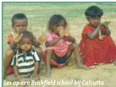
Les op een Brickfield school bij Calcutta

Een opvallende ontwikkeling is de toenemende zelfredzaamheid. Er ontstaan steeds meer initiatieven om zelf inkomen te genereren. De Self Help Groups (SHG's) van vrouwen spelen daarbij een belangrijke rol. In de regio Berhampur verkopen deze SHG's al duizenden kilo's chilipoeder en kurkumapoeder voor het bereiden van maaltijden. Ook krijgen zij steeds meer verantwoordelijkheid van de overheid. Een voorbeeld: Op de regeringsscholen worden door de overheid maaltijden verstrekt. Hiervan komt echter weinig terecht, omdat de schoolleiding vaak niet geïnteresseerd is en het geld voor andere doeleinden gebruikt. De SHG's hebben hierover geprotesteerd bij de overheid. Vervolgens is de verzorging en verstrekking van schoolmaaltijden bij de SHG's gelegd. Daarnaast krijgen zij ook taken van de overheid op het gebied van transport, onderhoud van wegen, hygiëne en waterhuishouding! Deze ontwikkeling is niet alleen waar te nemen in Berhampur, maar ook in de regio Calcutta en Balasore.