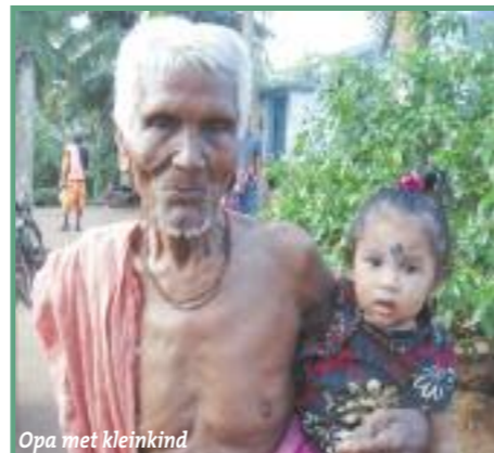
Opa met kleinkind

In dit internaat in de deelstaat Orissa verblijven momenteel 61 jongens. Zij volgen onderwijs in klas 1 tot en met 10 van de regeringsschool daar. De sanitaire voorzieningen in het internaat verkeren in een zeer slechte staat. De leiding vraagt SAC om ondersteuning voor de bouw van 4 toiletten en 4 doucheruimten. Daarnaast voor de aanleg van een watervoorziening en afvoer via een septic tank. Het gevraagde budget is € 2.772,=.