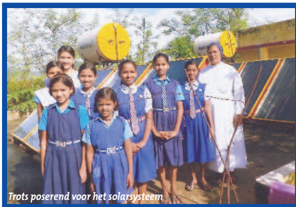
Trots poserend voor het solarsysteem

In Surada is een warmwatersysteem aangelegd waarbij het water door zonne-energie wordt verwarmd. Het warme water wordt gebruikt om te baden, vooral in de winter en mogelijk ook tijdens het regenseizoen. Bovendien wordt het water gebruikt bij het koken van voedsel. Hierdoor zijn de energiekosten voor het koken gehalveerd.