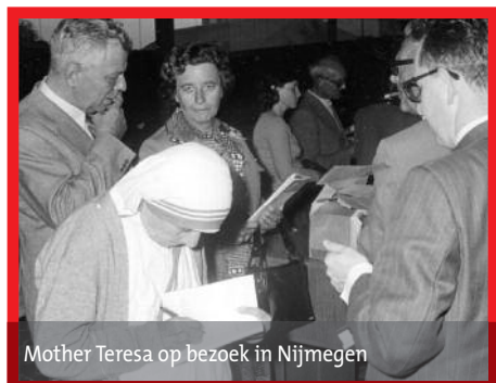
Mother Teresa op bezoek in Nijmegen